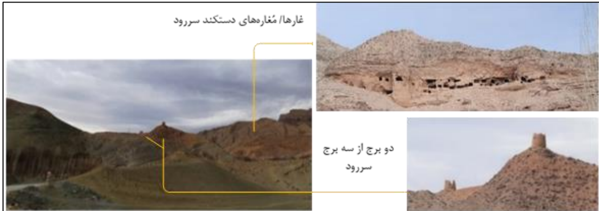
تصویر ۱۲: موقعیت آثار تاریخی روستای سررود شامل: قلعه گبرها و سه برج نسبت به یکدیگر

سه بُرج سررود: بر فراز کوهی مشرف بر جاده روستای سررود و در روبروی قلعه گبرها، برج‌هایی مشهور به سه برج و متعلق