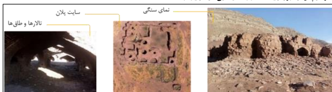
تصویر ۱۱: رباط آبگرم سایر آثار تاریخی غیرمنقول در دهستان پساکوه بخش زاوین شهرستان به شرح جدول ۶، می‌باشند.

راه، شاخه‌ای از نوغان به تبادکان و آبگرم می‌رفته و بعد به دره خور سرازیر می‌شده است (امیری و شاکری، به نقل از یاحقی، ۱۳۷۳: ۱۱۹-۱۲۰). بنابراین، بر پایه این پیشینه تاریخی، روستای آبگرم واقع در مسیر کاروان‌روی مذکور، اثر ارزشمندی چون یک کاروان‌سرا تحت عنوان رباط آبگرم را در خود جای داده است که در ادامه به تشریح آن می‌پردازیم. رباط آبگرم: بنای سنگی و سرپوشیده‌ای است که در میان دره‌ای سرسبز و پر آب در ۸ کیلومتری جنوب غرب روستای آبگرم قرار دارد. پلان بنا مستطیل‌شکل و محصور به برج‌هایی در گوشه‌ها است و ورودی آن از انتهای یک ایوان آغاز می‌شود و پس از عبور از یک دالان با اتاق‌هایی در طرفین، به