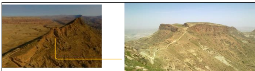
تصویر ۵: قلعه و ارگ فرود (داوری، ۱۳۹۶: ۶۹؛ نظرآهاری و همکاران، ۱۳۹۱)

قلعه و ارگ فرود: «قلعه و ارگ فرود» زمینی مستطیل‌شکل با طول و عرض حدودی ۵۰۰ و ۲۵۰ متر و نیز وسعتی معادل ۱۲٫۵ هکتار در راستای شمال غرب-جنوب شرق گسترده شده که در ۱۲ کیلومتری شمال غرب شهر کلات و در حدود یک کیلومتری شمال روستای گرو در محل تلاقی دو رشته‌کوه مرتفع (شکل‌دهنده‌های حصار طبیعی کلات) در نقطه‌ای حدود ۷۰۰ متر ارتفاع از کف دره واقع شده است. موقعیت قلعه به‌گونه‌ای انتخاب شده که از غرب به محور کلات-درگز و