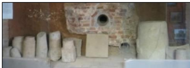
تصویر ۶: تپوشه‌های سفالی انتقال آب از قره‌سو به کلات

قره‌سو (۵ الی ۶ کیلومتری جنوب غربی حصار کلات) را به نقطه مورد نظر برساند، بدین‌صورت که با تطابق کامل اصول مهندسی، ابتدا کانالی با رعایت شیب استاندارد که تنظیم‌کننده فشار آب در آب‌نماهای اطراف عمارت خورشید بود، در مسیر انتقال حفر گردید که در برخی نقاط عمق کانال از سطح زمین به ۵ متر نیز می‌رسید، سپس با آماده‌سازی بستر با استفاده از تپوشه‌های سفالی بین ۳۰ تا ۶۰ سانتی‌متری و قطر دایره سنگ ۱۰۰ سانتی‌متری (که در ابتدا سنگ‌های بزرگی را به شکل سنگ آسیا تراش داده‌اند و بعد داخل آن‌ها را خالی کرده‌اند)، عملیات لوله‌گذاری انجام و روی آن‌ها با خاک نرم پوشانده شد و در قسمت‌هایی که احتمال آسیب‌زنی سیلاب وجود داشت، مسیر لوله‌کشی از طریق سنگ و ساروج محافظت شد. همچنین به سبب وجود میزان رطوبت بالا در عمارت خورشید، ناشی از آبیاری چهارباغ محوطه و نیز وجود ۱۵۶ فواره، هشت حوضچه و یک حوض بزرگ در آن، مسیر دورتادور عمارت به جهت جلوگیری از نفوذ آب و آسیب دیدن، با استفاده از خشت و ساروج مقاوم‌سازی گردید (بامداد، ۱۳۴۴: ۱۸؛ خسروی، ۱۳۶۷: ۶۱-۶۰؛ امیری و شاکری، ۱۳۸۵: ۱۱۳-۱۱۴). با گذشت زمان و عدم حفاظت و توجه، امروزه این سیستم آب‌رسانی از میان‌رفته، اما آثار آن در طی مسیر و خصوصاً داخل محوطه عمارت کاملاً نمایان است (تصویر ۶) و حتی فواره‌های داخل عمارت امروزه بازسازی شده‌اند (اگرچه مثل گذشته نیست، اما نمایی از گذشته با شکوه آن را در خاطر گردشگران زنده می‌کند).