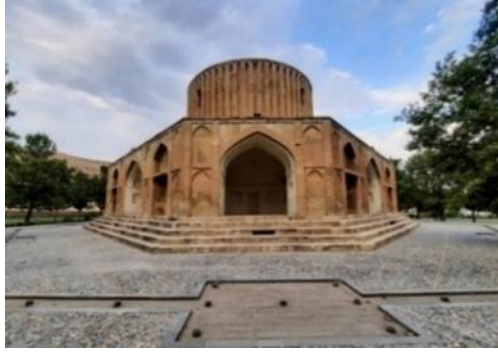
تصویر ۷: عمارت/ قصر/ کاخ خورشید، اضلاع جنوبی، جنوب غربی و غربی

(اسناد ثبتی اداره کل میراث فرهنگی، صنایع دستی و گردشگری).