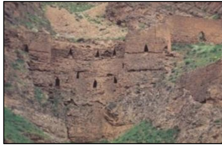
تصویر ۴: تپه و بقایای معماری قصر دختر (نظرآهاری و همکاران، ۱۳۹۱: ۳۰)

یک کوه به خز دختر شهرت دارد. تپه مذکور (تخت دختر) متعلق به دوره افشاریه است که با مالکیتی دولتی در تاریخ ۱۳۴۶/۰۱/۲۳ در فهرست آثار ملی با شماره ۶۶۹ به ثبت رسیده است (اسناد ثبتی اداره کل میراث فرهنگی، صنایع دستی و گردشگری). سایر دربندها و دروازه‌های فرعی دژ طبیعی کلات در این شهرستان، به شرح جدول زیر (جدول ۲) می‌باشند.