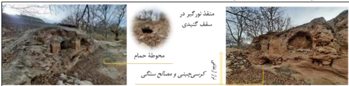
تصویر ۱۳: حمام قدیمی سررود

حمام قدیمی سررود: «حمام قدیمی سررود» بنایی است یادگار از دوران صفوی با مالکیتی عمومی که در حاشیه رودخانه عبوری قره‌تیکان قرار دارد و در تاریخ ۱۳۸۴/۰۵/۲۲