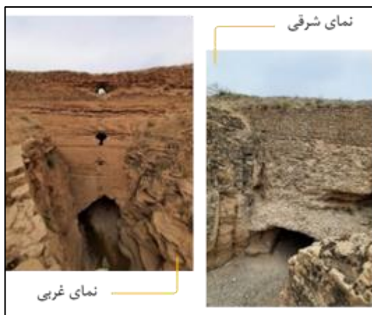
تصویر ۱۰: نماهای شرقی و غربی دیواره بند نادری