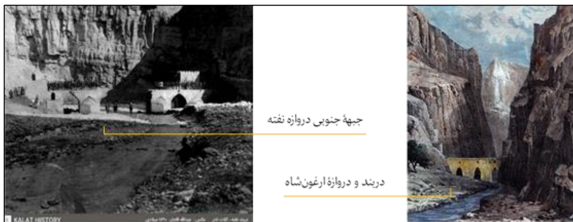
تصویر ۲: دریندها و دروازه‌های اصلی حصار طبیعی کلات (مأخذ: مک‌گریگر، ۱۳۶۸: ۶۵؛ نظاره‌اری و همکاران، ۱۳۹۱: ۱۲۱)

دریندها و دروازه‌های حصار کلات: مفهوم از واژه دریند «معبری است که از دو طرف با کوه‌های مرتفع محاط گردد». قلعه و حصار کلات به‌طور کل دارای پنج دریند راه عبور و دروازه اصلی و فرعی است. دروازه‌های اصلی آن عبارت‌اند از: دو دریند مهم در خاور شمال تحت عناوین دریند ارغون‌شاه (مدخل مسافری درگز و مشهد) و دریند نطفه (راه ایران به‌طرف ترکمنستان، وجود چشمه‌ای تحت همین نام در منطقه که روی آن چربی شیبیه نفت دیده می‌شود) (قدوسی، ۱۳۳۹: ۳۵) (تصویر ۲).