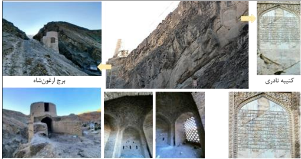
تصویر ۳: موقعیت کتیبه نادری و برج ارغون‌شاه نسبت به یکدیگر در دریند ارغون‌شاه

حاضر، دروازه ارغون‌شاه کاربری خاصی ندارد، چراکه در دهه‌های اخیر گذرگاهی به شکل تونل در دل کوهی در مجاورت و هم‌راستا با دروازه احداث گردیده و متأسفانه در اثر سیل‌های عظیم رودخانه ژرف‌رود که از این تنگه می‌گذرد،