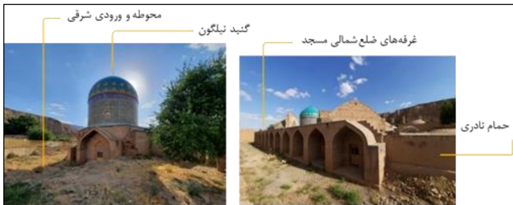
تصویر ۸: مسجد کبودگنبد

می‌توان بیان نمود که ساخت بنا به سال‌های آغازین حکومت نادر بازمی‌گردد که عملیات ساخت را در تمام طول پادشاهی (تا ۱۱۶۰ق) ادامه‌دار دیده‌اند. کتیبه ثلث بسیار زیبای «سوره نباء» در قسمت دورتادور فضای داخلی گنبد نیز به همین تاریخ اشاره دارد. ناتمام ماندن عملیات حجاری بر روی سنگ‌های بدنه نشان از آن دارد که کار در بنا حتی تا زمان مرگ نادر نیز تمام نشده و معماران هندی که برای حجاری بنا از هندوستان به کلات آورده شده بودند، با شنیدن خبر مرگ نادر، کار را نیمه‌تمام رها کرده و از منطقه دور شده‌اند (حیدری‌بنی، ۱۳۸۸: ۴۴). در گذشته این بنا به «مقبره» شهرت داشته و هم‌اکنون نیز معمرین از آن به‌عنوان مقبره نادر یاد می‌کنند که احتمالاً شهرت آن به کاخ و قصر مربوط به اواخر دوران قاجاریه است که در آن زمان از این مکان به‌عنوان فضایی حاکم‌نشین استفاده می‌کرده‌اند (امیری و شاکری، ۱۳۸۵: ۱۰۷). این بنا با مالکیتی دولتی در تاریخ ۱۳۱۸/۱۱/۲۰ با شماره ۳۲۹ به ثبت ملی رسیده است