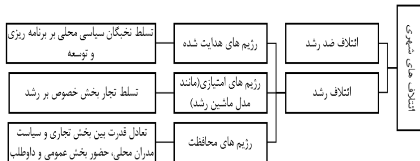
شکل ۱: مفاهیم ائتلاف‌های رشد، رژیم‌های شهری و ماشین رشد شهری، بازسازی‌شده بر اساس Fainstein & Fainstein, 1986 (به نقل از

رژیم‌ها و ماشین رشد شهری: مفاهیم ماشین رشد و رژیم‌های شهری بر مشارکت جهت دستیابی به هدف مشترک از طریق یک ائتلاف دلالت دارند. استدلال نظری رژیم در بسیاری از جنبه‌های مفاهیم ماشین رشد منعکس شده است. در تئوری رژیم، نقطه قطعی در درک سیاست‌های رشد در شهر این است که مقامات دولتی احساس کنند مجبور به مشورت با ذینفعان زمین هستند و چشم‌اندازهای انتخابی‌شان به مزایای حاصل از تلاش‌های توسعه‌گره خورده است و تجار بر این باورند که آن‌ها جایگاه ویژه‌ای در سیاست‌های شهر دارند. محور تمایز بین ماشین رشد و ادبیات رژیم، نقش سیاست‌ها است. در ماشین رشد، اتصال بین منافع ارتقاء دهنده رشد و سیاستمداران تقریباً نامتقارن است. در مقابل، نظریه رژیم ادعا می‌کند که به دلیل مزایای سیاسی و درآمدها برای مقاماتی که شهر را اداره می‌کنند، سیاستمداران نه‌تنها شرکت‌کنندگان فعال در یک ائتلاف رشد، بلکه شرکای متقابل در اهدافش هستند (Elkins, 1995: 585).