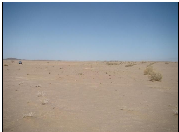
تصویر ۲) دشت جنوب سرایان

به طور کلی قسمت اعظم شهر سرایان را جلگه و بقیه را کوه و دشت تشکیل می‌دهد. در جنوب سرایان دشت وسیعی وجود دارد که خاک آن رس و برای کشاورزی بسیار حاصلخیز است و بیشتر این زمین‌ها در زمستان پرباران از رودخانه‌ها مشروب می‌شوند. با توجه به خشکی هوا و مساعد نبودن جنس خاک (در جلگه کویری و در کوه‌های گچی و آهکی) امکان رویش درختان موجود نیست و آنچه هم وجود داشته بر اثر عدم توجه اهالی و پی نبردن به اهمیت آن‌ها از بین رفته و سبب گسترش شن‌زارها و کویرها گردیده است (تصویر ۲). مهمترین درختچه‌های سازگار با محیط شهرستان عبارتند از: قیچ، اسکمیل، تاغ، گز و اغلب بوته‌های تریخ، اسپند، شور و کده.