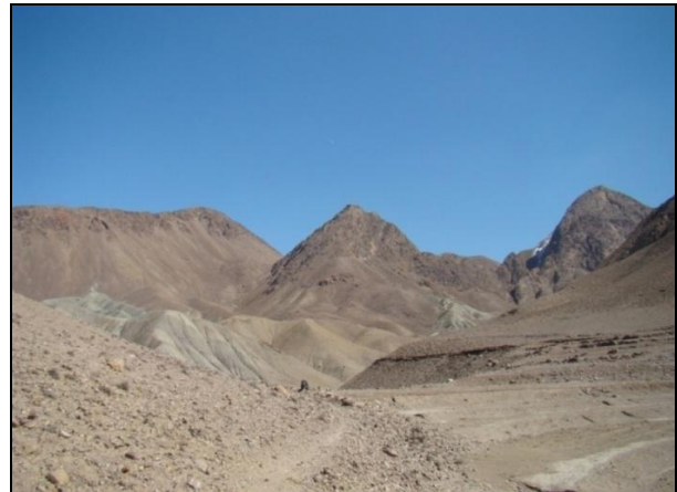
تصویر ۱) قلعه قلاع در شمال سرایان

از مهمترین شاخصه‌های این دوران کشف و بکارگیری فلز مس می‌باشد. بدون تردید پیشرفت و نوآوری در زمینه فلزکاری، از مهمترین ویژگی‌های این عصر به شمار می‌رود (همان، ۹). چگونگی ذوب فلز مس و ساختن اشیاء مسی با استفاده از روش قالب‌گیری در سیلک III کاشان مشاهده شده است (ملک شه‌میرزادی، ۱۳۷۵: ۱۶۶). علاوه بر این، نوآوری‌هایی در سنت معماری از قبیل استفاده از خشت‌های سیگاری، که در سیلک III (همان) و چغامیش خوزستان (ملکشه‌میرزادی، ۱۳۸۲: ۲۱۶) مشاهده شده، نیز ایجاد گردید. همچنین تدفین عصر مس‌سنگ نسبت به دوره قبلی، یعنی نوسنگی، تغییر چندانی نداشته و همچنان تدفین در زیر مناطق مسکونی ادامه داشته است (همان). در این عصر تحولات مهمی در ساخت سفال انجام می‌گیرد. این روند تا آنجایی پیش می‌رود که هنر سفال‌گری پیش‌از تاریخ ایران، در این دوره به اوج خود می‌رسد (Alizadeh, 2006: 73). از تغییرات اساسی ساخت سفال در این زمان، اختراع کوره‌های پیشرفته دویخشی و چرخ سفال‌گری و به تبع آن، ساخت سفال‌های چرخساز ظریف با پخت کافی است. پدیده اواخر مس‌سنگی ایران، پیدایش ظروف سفالین مصرفی، ساده و خشن به نام کاسه‌های لبه‌واربخته است. این کاسه‌ها به لحاظ ساخت، با دست یا قالب شکل داده شده‌اند. در بعضی از محوطه‌های باستانی از جمله تپه فرخ‌آباد