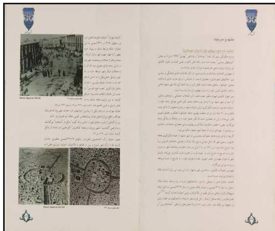
تصویر ۱: خیابان فلکه ه