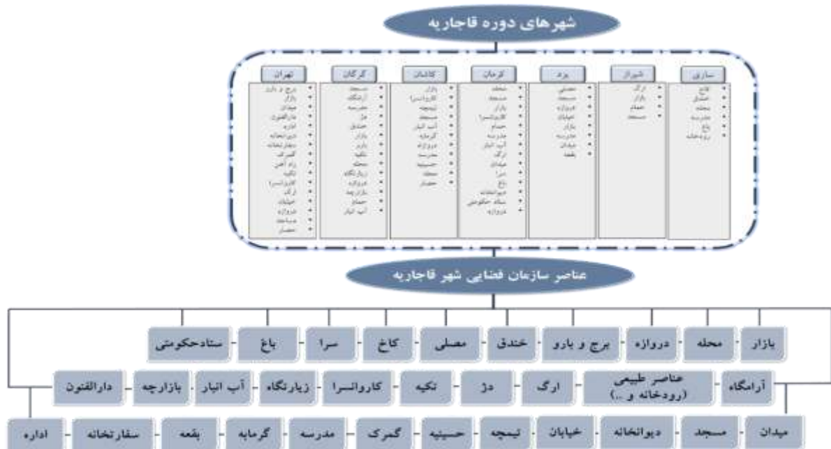
نمودار ۲. عناصر سازمان فضایی شهر دور قاجاریه