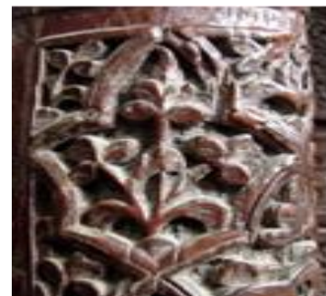
تصویر ۹- گل سه برگی بر دماغه در اصلی

"خداوند در قرآن هفت بار به اولیاءالله سلام می‌گوید. (سوره‌های مبارکه یس، صافات ۷۸ و ۱۱۰ و ۱۲۱ و ۱۳۱ و ۱۸۲، قدر ۵)" (بقایی، ۱۳۸۵: ۲۰۹ و ۲۱۰) کلمه اسلام نیز در قرآن هفت بار تکرار شده است. (شیمل، ۱۳۸۸: ۱۶۱) (تصویر ۸) گل‌های سه‌برگی (تصویر ۹) که به وفور در نگارهای گیاهی بویژه دماغه در و ترنج‌ها طراحی شده، یادآور طبیعت سه‌گانه است. در اساطیر ایران جمشید دارای سه فره نماد ریاست برحکومت، دین و پهلوانان است. (نورآقایی، ۱۳۸۸: ۴۱ و ۴۲) نماد نفس و دو حد نهایی و یک میانه است و نشانه هماهنگی. (اردلان و بختیار، ۱۳۸۰: ۲۷) شکل شیعی شهادت در سه جمله لا اله الا الله، محمد رسول الله و علی ولی الله است. (شیمل، ۱۳۸۸: ۸۰) سه چلیپای با نام مبارک علی (ع)، سه مرتبه فتوت را دلیل است. ترنج‌ها که به عنوان قاب اصلی در دو طرف در اصلی طراحی شده‌اند نشان از ۴ مرحله سیر و سلوک، ۴ سلام سماع و ۴ مرحله شریعت، طریقت، حقیقت و معرفت را نشان دارد. ارکان طریقت و فضایل هم به یک‌بار در ۴ منحصرند. ۴ پیر در مقامات مختلف در مرام‌نامه‌های اصناف مقامی بلند دارند. (تصویر ۱۰) گل اناری ۵ پر که به عنوان یکی از شاخ‌ترین گل‌های ترنج قاب میانی در، نشان ۵ تن آل عبا، مهم‌ترین اشخاص شیعه و مورد احترام اهل تسنن، پیامبران اولوالعزم به‌عنوان ۵ پایه اسلام بنا به نظر اخوان الصفا شیعی است (شیمل، ۱۳۸۸: ۱۳۱-۱۲۷) (تصویر ۱۱).