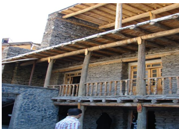
تصویر ۳. نمایی از ایوان مسجد و ۲ طبقه زیرین

شده‌اند. هنگام دیوارچینی هر بیست تا سی سانتیمتر، سنگ‌چین می‌شود، سپس با ملات گِل فضای خالی بین سنگ‌ها پر می‌شود. روی هر چهار تا پنج ردیف سنگ‌چین، چوبی به حالت افقی قرار گرفته تا ضمن یکنواخت کردن سطح دیوار، حالت قفل و بست بدان داده و بر استحکام آن بیفزاید و لذا معماران در راستای استفاده از مصالح اقلیم کوهستانی از این موضوع بهره برده‌اند.