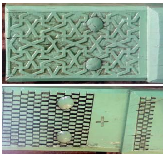
تصویر ۲. نقوش هندسی بر چارچوب‌های زیر سقف مسجد ازقده.