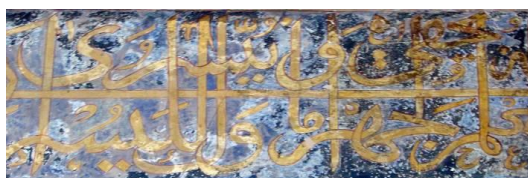
تصویر ۴. قسمتی از کتیبه سراسری هشتی مسجد

اعلی است. در این آیات به توحید خدای تعالی امر شده، توحیدی که لایق به ساحت مقدس او باشد و نیز به تنزیه ذات متعالیه‌اش از اینکه نام مقدسش، نام دیگری ذکر شود و یا چیزی که باید به او مستند شود به‌غیر او نسبت دهند. مثلاً کسی دیگر را در خلقت و تدبیر و رزق شریک او بدانند و به رسول خدا(ص) وعده تایید می‌دهد، تایید به-