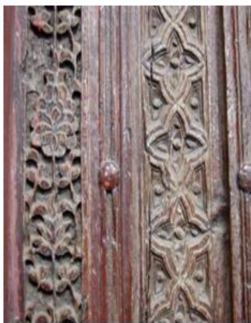
تصویر ۸- گل‌های ۷ و ۸ بر بر چهارچوب در اصلی

و توبه، نیز ۱۲ بار نام مولای متقیان، از طرفی دیگر نگاره‌هایی چون گردونه مهر، سرو، شمس، گل‌ها و تعداد آنها نشان از آیین فتیان دارد که در جامعه قرن ۹ هجری قمری ساری و جاری بوده است. کتیبه الله مفتح‌الابواب اشاره به بازبودن درهای رحمت خداوندی و نیز گشاده‌بودن درهای توبه در همه حال بر بندگان را دارد. از طرف دیگر کتیبه نقش‌بسته بر ستون مقابل محراب حاوی اصطلاحاتی است که به ارکان و شرایط اهل فتی برمی‌گردد. فتح در کارها و اصل توبه از ارکان فتوت بوده بلکه اول قدم در راه فتیان است (کربن، ۱۳۶۳: ۲۴). ذکر الله مفتح‌الابواب از اسامی اعظم و بارها در دعا و احادیث ذکر شده که بر بالای دماغه ورودی نقش بسته است. این ذکر قدر مسلم برای هر انسانی که قصد ورود به مسجد را داشته دارای بار معنایی والایی بوده است. توکل به خدا و راضی‌بودن به رضای او از