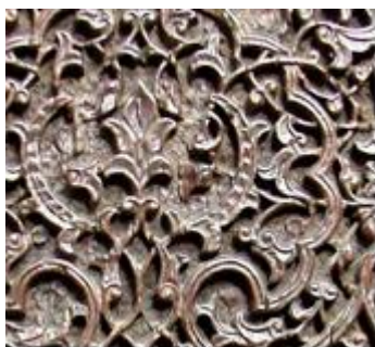
تصویر ۱۱- گل پنج پر نقش شده بر ترنج قاب میانی در اصلی