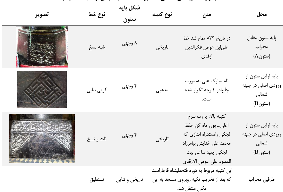
جدول ۱. کتیبه‌های حکاکی شده بر سنگ، مسجد جامع ازقذ