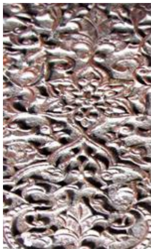
تصویر ۷- شمس و گل هفت‌پر مثبت‌شده بر قاب میانی در اصلی مسجد