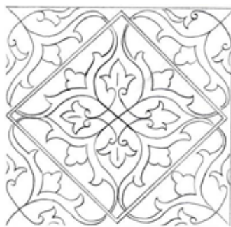
تصویر ۱۰- ترنج بر بالای قاب سردر ورودی اصلی