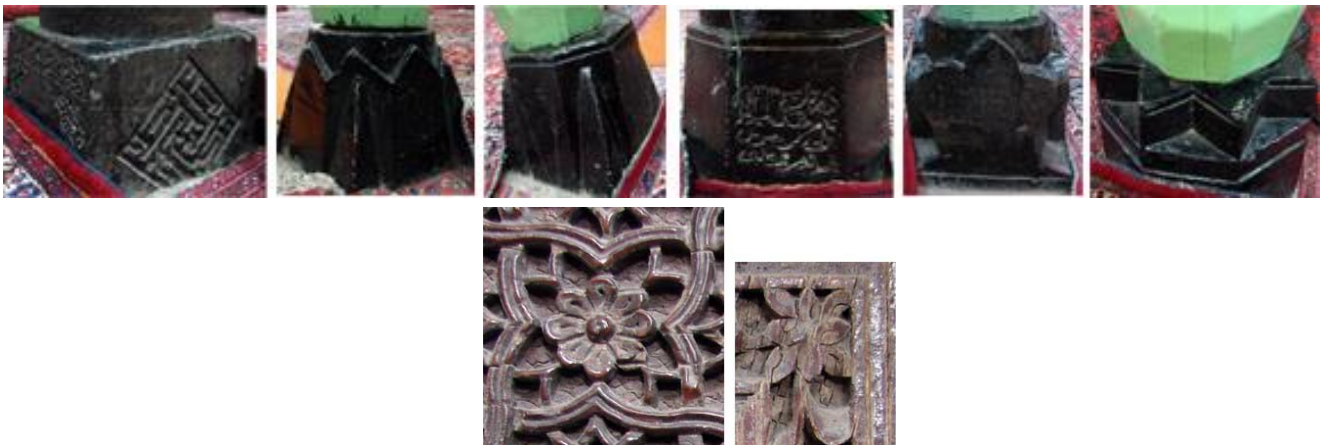
تصویر ۱۲- گل هشت پر در متن و حاشیه در ورودی و فرم پایه ستون های مسجد

است. (غراب، ۱۳۸۴: ۲۱۶) نشانه امام هشتم شیعیان که به عنوان یکی از پیرهای ۴ گانه طریقت در مرام نامه های اصناف است. سرو که در پشت در ورودی و ستون روبروی محراب به سادگی به تصویر کشیده شده، درخت همیشه سبز و از دیرباز درخت خاص ایرانیان است که زرتشت آن را از بهشت آورده است. در شعر فارسی با صفات متعددی چون سرفراز، جوانه نوحاسته، پابرجای، پایدار، بوستان آزادی و ... آمده است (یاحقی، ۱۳۶۹: ۲۴۵). سرو نشانی از پایداری و پایداری اهل فتیان در برابر مسایل و مشکلات زمانه دارد و مهر تاییدی بر کتیبه روی دماغه در است که خداوند به صبر و استقامت بشارت داده و توکل راه هدایت را نوید می دهد.