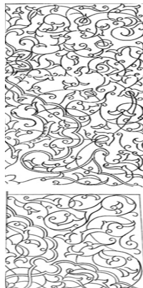
تصویر ۶- واگیره قاب میانی و بالا روی در اصلی ورودی مثبت‌کاری شده

متنوع چون فرهنگ عمومی یک جامعه سنت‌های گذشته، آگاهی‌ها و سلیقه‌های فردی و گروهی، محیط و زمینه قرارگیری و شکل و ویژگی‌های کالبدی آن بستگی دارد" (دیباج و سلطان‌زاده، ۱۳۷۷: ۱۱۰). بارزترین نگاره، شمس شش‌پر منقوش در ورودی است (تصویر ۷) که نماد "انوار حاصل از تجلیات الهی و حقیقت نور خدا و ذات احدیت است" (سجادی، ۱۳۷۰: ۳۷۴). شش نماد اعتدال و هماهنگی، عشق، تندرستی و زیبایی است (کوپر، ۱۳۸۶: ۳۰).