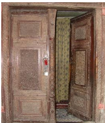
تصویر ۵. در ورودی اصلی

اعتقاد نگارنده مقاله بر این فرض استوار است که این مکان بنا به شواهد موجود مسجد بوده است. اول اینکه "معماری مساجد عهد