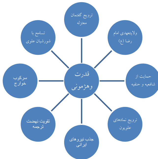
نمودار ۲. مفصل‌بندی گفتمان حکومت عباسی در دوران خاندان طاهری

توفیق نبود و از متزلزل شدن گفتمان مأمون و گسست بین دال‌های مفصل‌بندی شده در این نظام گفتمانی حکایت می‌کرد. سپردن منطقه خراسان به‌دست عبدالله‌بن‌طاهر در همین چارچوب نیز قابل تحلیل می‌باشد که ناشی از تدبیر مأمون در فرونشاندن قیام‌های ملی‌گرای ایرانی و خوارج بود و آنگاه که سیاست قبلی خود را ناموفق یافت مرکز خلافت را از مرو به بغداد منتقل کرد و عبدالله‌بن‌طاهر که عامل قتل خلیفه قبلی بود را از بغداد دورساخت تا کینه‌های بنی‌عباس منجر به قتل طاهر نگردد. مهمترین هدف طاهریان حفظ قدرت خود به‌هر بهایی بود و جلب رضایت دستگاه خلافت مهمترین عامل دست‌یابی به چنین هدفی محسوب می‌شد. علی‌رغم این که طاهریان اصالتاً از اهالی پوشنگ هرات بودند ولی با هر نمادی که منجر به تضعیف گفتمان خلیفه می‌شد مخالفت می‌کردند و آتش زدن کتاب «وامق و عذرا» در این چارچوب قابل تفسیر می‌باشد (مطهری، همان: ۱۰۴).