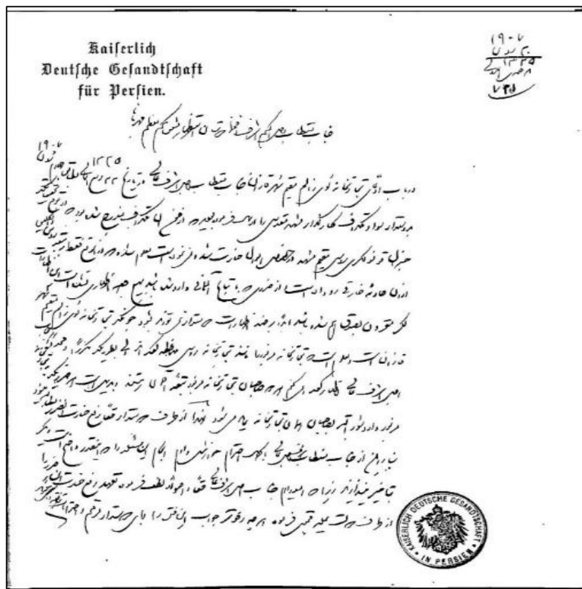
نامه سفارت آلمان به وزارت خارجه ایران درباره پرداخت خسارت به تجارتخانه لوی‌زالم (استادوخ: ۱۳۲۵-۲-۹/۲-۶۳-۱۳۲۵ق)

تجارتخانه لوی‌زالم کرده بود و در وزارت خارجه ایران هم تجارتخانه لوی‌زالم به تجارتخانه روسی معرفی شده بود تاکنون به سفارت آلمان پاسخی جهت رفع این مسئله اعاده نشده است. اکنون که مشخص شد تجارتخانه لوی‌زالم