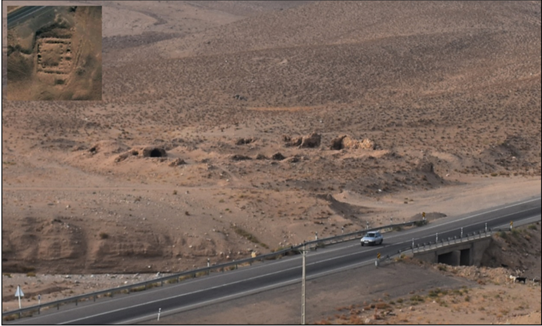
تصویر ۴: رباط سنگی کرات

قسمت طاق‌ها و نیز مصالح بکار رفته در آن قابل انتساب به سده ۹ و ۱۰ هجری است. آلفونس گابریل از جمله کسانی است که به بازدید از این اثر پرداخته؛ و در آن دو لوح مرمر