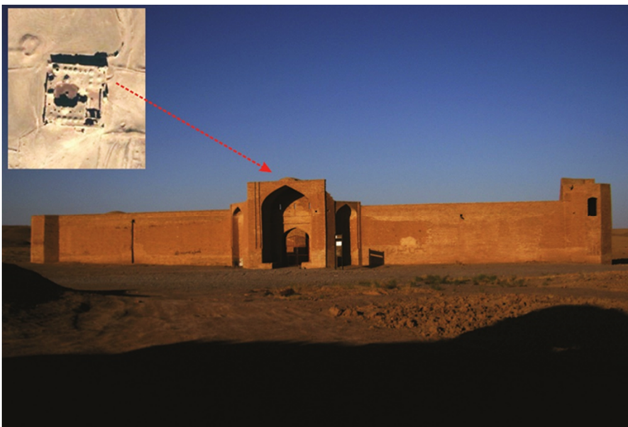
تصویر ۵: کاروانسرای عباس‌آباد

دوطبقه بوده و در بالاترین قسمت دارای کنگره هستند. در حال حاضر به دلیل تجاوزها و تخریب‌هایی که صورت گرفته، از تأسیسات داخل اثر چیزی بر جای نمانده است. از میان سیاحان، وامبری و خانیکوف در این کاروانسرا اقامت داشته (وامبری، ۱۳۸۷: ۳۷۰؛ خانیکوف، ۱۳۷۵: ۱۳۴) و فرد اخیر از آب‌انباری نیز در این کاروانسرا یاد کرده است (همان). بازدید از این اثر به دلیل استقرار نیروهای نظامی در حال حاضر امکان‌پذیر نیست؛ اما با توجه به شواهد معماری احتمالاً قدمت ساخت این اثر نیز به دوران تیموری و صفوی قابل انتساب است.