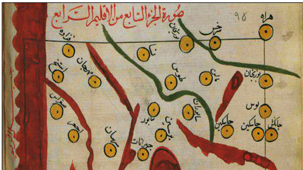
تصویر ۱: بخشی از نقشه اقلیم چهارم و جایگاه شهر مالن در آن (ادریسی، ۱۳۹۱)

ایران، موضع مألن را مشخص نموده است که نشان‌دهنده اهمیت این شهر در جغرافیای سیاسی-اداری خراسان در سده‌های میانی است (ادریسی، ۱۳۹۱).