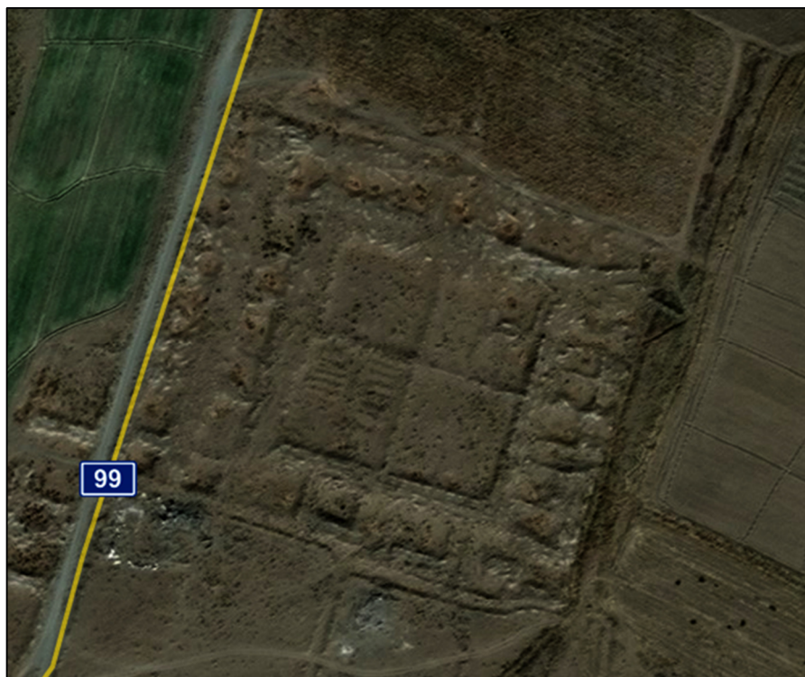
تصویر ۷: نمای هوایی کاروانسرای هشتادان

کاروانسرای هشتادان: کاروانسرای هشتادان در فلاتی به همین نام، در امتداد مرز ایران و افغانستان واقع شده است. دشت هشتادان از شمال به تپه‌های سنجدی، از جنوب به کوه گدایانه، از شرق به رشته‌کوه سرخر (سنگ دختر) و از غرب به آبپخشان میان قنات‌های هشتادان و جریان‌های به سمت سرزمین ایران منتهی می‌گردد (رمضانی، ۱۳۸۲: ۹۸-۹۴؛ مجتهدزاده، ۱۳۷۸: ۷۲). این دشت امروزه خالی از سکنه است؛ ولیکن در دوران گذشته به دلیل ویژگی‌های اقلیمی و نیز مسیر ارتباطی با غوریان از یک سو و خواف از سوی دیگر، نقش مهمی در ارتباطات منطقه‌ای داشته است. واژه هشتادان متشکل از دو واژه هشتاد و دان است و به هشتاد قناتی اطلاق می‌شده که در گذشته این منطقه را آبیاری می‌نموده است و گواهی بر عظمت این منطقه در گذشته دارد (بیت، ۱۳۶۵: ۱۲۲). در این دشت آثار وسیعی متعلق به سده‌های نخستین تا متأخر هجری وجود دارد که در مساحتی بالغ بر ۲۰۰ هکتار پراکنده شده‌اند. اگرچه این آثار به دلیل فرسایش خاک و نیز کشت متعدد رو به ویرانی