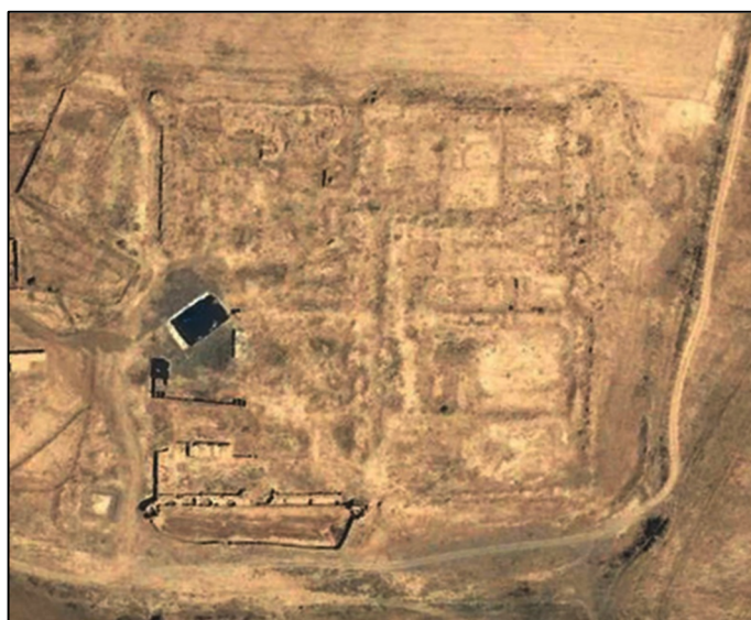
تصویر ۶: نمای هوایی کاروانسرای دوغارون

کاروانسرای دوغارون: از جمله تأسیسات دیگری که می‌توان به آن اشاره نمود، کاروانسرای دوغارون در کنار روستایی به همین نام است. این اثر در موقعیت جغرافیایی 34^{\circ}44'22.93'' شمالی و 60^{\circ}53'11.49'' شرقی، در فاصله ۱۲ کیلومتری شهر تایباد و ۲۰ کیلومتری اسلام قلعه در ایالت کوهسان/کوسویه در خاک افغانستان واقع شده است. این اثر، سازه-ای چهارگوش به ابعاد 160 * 160 متر است که با استفاده از مصالحی همچون خشت و چینه ساخته شده است (تصویر ۶). کاروانسرای دوغارون دارای ۸ برج مدور به قطر ۷ متر است که در زوایا و میانه دیوار ساخته شده‌اند. این برج‌ها