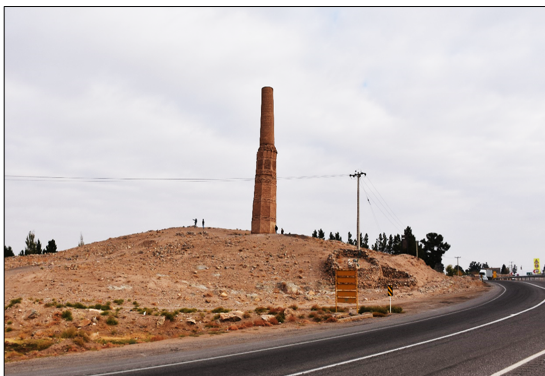
تصویر ۲: میل کرات

این اثر در قسمت ساقه دارای شکل هشت‌وجهی است که هر وجه آن ۱,۹۰ متر طول دارد و جمعاً حدود ۱۵,۲ متر محیط آن است. این بخش هشت‌وجهی حدود ۱۵,۵ متر ارتفاع دارد و تا کمرگاه ادامه یافته و سپس از این قسمت، مناره شکل استوانه‌ای به خود می‌گیرد؛ که به تدریج از قطر آن کاسته شده و در انتها به ۷ متر می‌رسد. ارتفاع این قسمت نیز در حدود ۱۰ متر است. ورودی بنا در جبهه شرقی اثر قرار گرفته است و متشکل از درگاهی به ارتفاع ۱,۶۵ متر و عرض حدود ۷۰ سانتی‌متر است. در داخل اثر تعداد ۹۵ پله مارپیچ در جهت خلاف عقربه‌های ساعت به نوک میل راه می‌یابد.