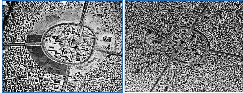
تصویر ۱: عکس هوایی از حرم مطهر و بافت مرکزی شهر مشهد، سال‌های ۱۳۳۵ ش و ۱۳۵۴ ش

ملاحظه عکس‌های هوایی شهر مشهد در ۱۳۵۴ ش نشان می‌دهد اقدامات مبتنی بر مصوبات طرح جامع شهری در این زمان نمایان شده است. هرچند در این تصویر بافت سنتی شهر مشهد هنوز پایدار است، اما مداخلات صورت گرفته در اطراف حرم مطهر امام رضا (ع) ، مبتنی بر اجرای اولین