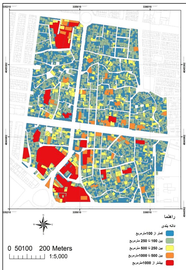
شکل ۴: نقشه دانه‌بندی قطعات بافت فرسوده

خوبی برای اجرای این طرح در بافت فرسوده سرخس بوده و عملاً وجود سایر کاربری‌های مورد نیاز، سطح بسیار کم کاربری‌های آلاینده و وجود سطح بالای اراضی بایر و قبلاً توسعه یافته، شرایط پذیرش این الگو در بافت را بسیار بهینه و مطلوب می‌نماید.