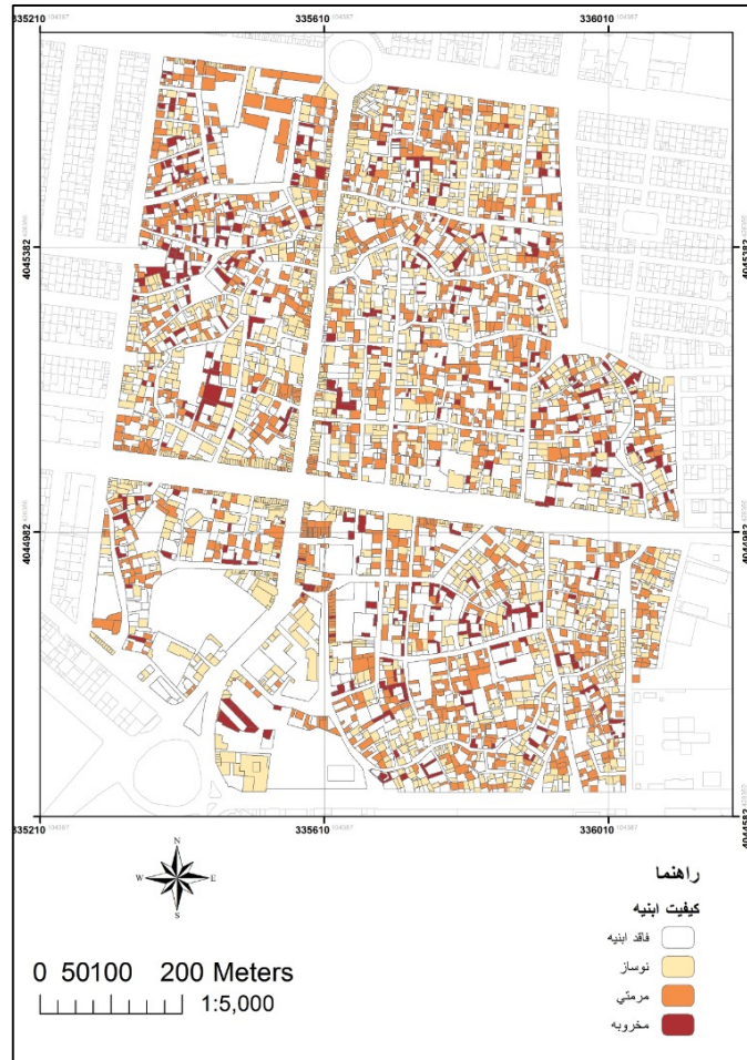
شکل ۳: کیفیت اینیه بافت فرسوده

املاک، شرایط ساخت خانه ویلایی تک طبقه وفق الگوی توسعه میان افزا و پذیرش ساکنین برای ساخت و احیاء مجدد بافت، می‌توان اذعان نمود که شرایط دانه‌بندی قطعات بافت فرسوده شهر سرخس ظرفیت خوبی برای اجرا و پیاده‌سازی الگوی مذکور را دارا می‌باشد.