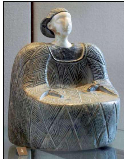
تصویر ۹. نمونه‌ای از پیکرک‌های باختری، گنورتپه