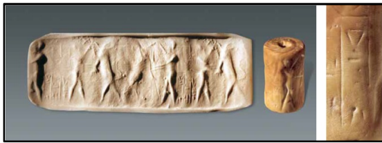
تصویر ۳. مهر استوانه‌ای از گنورتپه