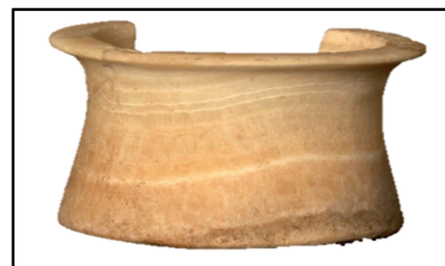
تصویر ۸. نمونه از ظروف مرمری، گنورتپه