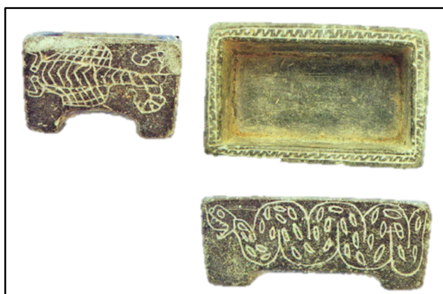
تصویر ۷. محوطه چلو