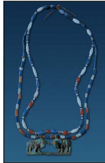
تصویر ۱. گردنبندی به همراه دو آویز مرصع با سنگ‌های لاجورد و عقیق

همچنین در یک کتیبه آشوری، شمش‌ی آدد اول (۱۷۸۲-۱۸۱۵ ق.م) این چنین بیان می‌دارد: «در آن زمان من به واقع به آشور، شهر خویش، خراج پادشاهان توکریش و پادشاه سرزمین مرتفع را آوردم» (Laessoe, 1963:28). استنکلر، (۱۳۹۲:۲۲). با توجه به متن این کتیبه، نمی‌توان این سرزمین را، جایی در نزدیک بین‌النهرین در لرستان یا شمال غرب ایران جستجو نمود. به احتمال این نام مکان به بخش‌هایی از مرغیانه که احتمالاً تا حصار و دشت‌های گرگان در غرب گسترش داشته، اطلاق می‌شده است. احتمال این مسئله پیش می‌آید که اگر توکریش را در جایی در شمال شرق ایران و با فاصله‌ای دور از بین‌النهرین مکان‌یابی کنیم، چگونه این سرزمین به بین‌النهرین خراج می‌داده است؟ باید توجه