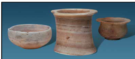
تصویر ۷. اُلغ تپه

سنگ مرمر و سنگ گچ ساخته می‌شد (امان‌اللهی، ۱۳۸۷: ۶۴). از تپه دامغانی سبزار نیز قطعات ظروف مرمری کشف شده که شبیه نمونه‌های حصار (IIIC)، شاه تپه (IIB) و نمونه‌های جنوب ترکمنستان است (وحدتی و فرانکفورت، ۱۳۸۹: ۲۹). همچنین شواهد استفاده از سنگ مرمر به صورت قطعات خام، کارشده، مهره سوراخ‌دار و قطعات کوچک و شکسته ظروف مرمری از محوطه شهرک فیروزه نیشابور شناسایی شده است (نامی و باصفا، ۱۳۸۹: ۱۳۱-۱۲۹). شواهد و مدارک موجود از محوطه‌های حصار، تپه‌دامغانی، شهرک فیروزه و محوطه‌های جنوب ترکمنستان (گنور، آلتین‌تپه و اُلغ تپه) نشان می‌دهد که صنعت تولید ظروف و اشیاء مرمری در عصر مفرغ متأخر این منطقه از رونق بسزایی برخوردار بوده است (تصویر شماره ۶). همزمانی رونق ساخت این تولیدات با اشاره متون بین-النهرینی به صادرات ظروف مرمری از توکریش قابل توجه است.