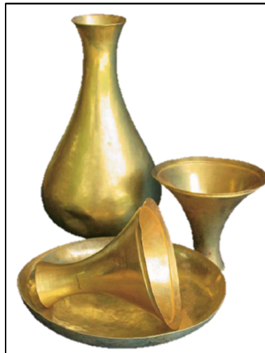
تصویر ۱۰. ظروف طلایی گنورتپه

می‌شده است، پس نباید در سایت‌های این منطقه به دنبال دست‌ساخته‌های طلایی گشت، بلکه وجود معادن طلا و استخراج آن در این بازه می‌تواند دلیلی برای صادرات طلا از گستره فرهنگ بلخی-مرویی به بین‌النهرین باشد.