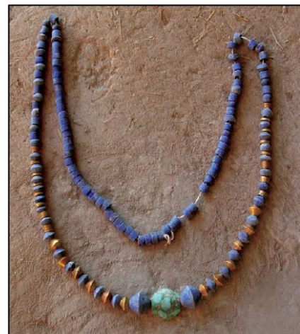
تصویر ۲. گردنبندی متشکل از سنگ لاجورد، فیروزه و مهره‌های طلایی