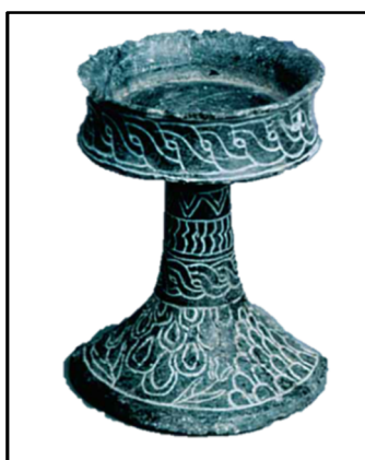
تصویر ۸. نمونه‌ای از ظروف صابونی گنورتپه

۱۷۰۰ ق.م) است. داده‌های باستان‌شناسی استفاده از سنگ صابون را در شهرک فیروزه نیشابور تأیید می‌کند. از کاوش‌های باستان‌شناسی این محوطه قطعات کارشده این سنگ به دست آمده (نامی و باصفا، ۱۳۹۲:۱۶۲-۱۶۰/ باصفا و رحمتی، ۱۳۹۱:۶۲۲). همچنین اشیاء و ظروف صابونی در محوطه چلو شناسایی گردیده است (تصویر شماره ۷) (وحدتی و بیشونه، ۱۳۹۳:۳۲۰). شواهد استفاده از این سنگ را به صورت انواع ظروف و مهره در گنورتپه (Sarianidi, 2007)، تغلق و قبرستان آوچین، در واحه مرو (Kohl, 1984:145) و همچنین از ساپالی‌تپه و اُلغ‌تپه (Bendezu-Sarmiento, 2013) را در اختیار داریم (تصویر شماره ۷ و ۸).