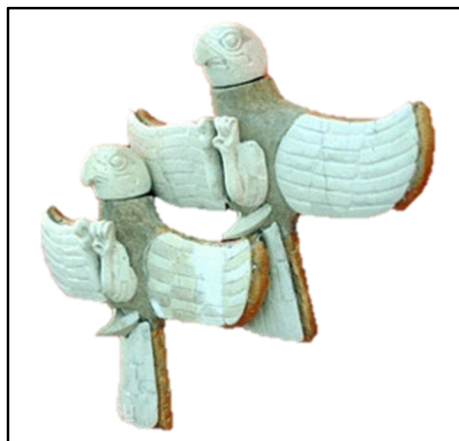
تصویر ۴. عقاب‌های ترکیبی، گنورتپه

به‌ویژه در میان نقوش مهرهای فرهنگ بلخی-مرویی مشاهده می‌گردد. فراوانی نقش پندگان شکاری و به‌ویژه نقش عقاب در این فرهنگ، نمونه‌ای مشابه‌ای در فرهنگ‌های هم‌زمان خود ندارد (Parpola, 2002:305). همچنین آویزه‌های به شکل عقاب، که از شوش و ابلا پیدا شده است را، محصول وارداتی از فرهنگ بلخی-مرویی می‌دانند (استنکلر، ۱۳۹۲:۲۲).