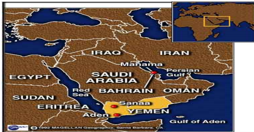
نقشه شماره ۱ موقعیت سیاسی کشورهای حاشیه خلیج فارس

از سویی دیگر، باید این موضوع را مورد توجه قرارداد که قدرت‌های بزرگ تلاش دارند تا از یک سو بازیگران منطقه‌ای را کنترل نمایند و از طرف دیگر، بر سرشت و مسیر حوادث منطقه‌ای تأثیر به‌جای گذارند. در نهایت منابع اقتصادی منطقه را تحت کنترل قرار دهند. در چنین شرایطی است که ساختار امنیت منطقه‌ای بر اساس کنش قدرت‌های بزرگ شکل گرفته و این امر به حوزه خلیج فارس نیز منتقل می‌شود. این موضوعی است که در برنامه‌ریزی، تحلیل عوامل مؤثر بر استقرار شهرهای شبه جهانی در سواحل جنوب می‌بایست با تیزی و دقت بسیار مدنظر قرار گیرد.