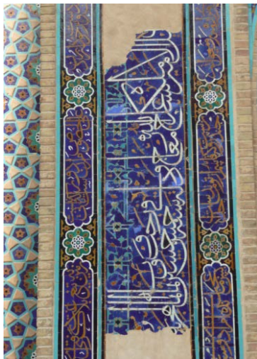
تصویر ۷) قسمتی از نمای مدخل ورودی مسجد شاه

در مسجد جامع اوبه هرات نیز، کتیبه‌ای به خط نسخ وجود دارد که مضمون آن نشان می‌دهد مسجد جامع در ربیع‌الاول ۸۳۲ ه.ق توسط دو فرد با ملیت مختلف که در زیارت خانه خدا با هم پیمان برادری بسته بودند ساخته شد و نگارش کتیبه نیز بر عهده حافظ اوبه‌هی ۱ بود (ویلبر، ۱۳۷۴: ۴۷۶).