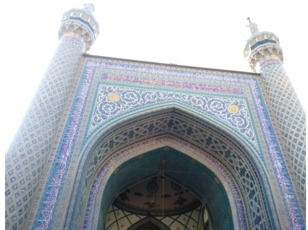
تصویر (۱) تزئینات کتیبه‌ای ایوان مقصوه مسجد گوهرشاد مشهد

نوشتن کتیبه‌های قرآنی، دعایی و حدیثی به خط ثلث، احتمالاً به سبب القاء حس نیاز و طلب معشوق، شکوه و قدرت معبود است که با توجه به نوع کاربری امکان مذهبی در بیننده پدید می‌آید.