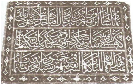
تصویر ۴) کتیبه مقابل محراب مسجد حوض کرباس

با توجه به نگارش آیه الکرسی بر روی محراب مسجد و قرار گرفتن این ابیات بر دیوار مقابل آن، تأکیدی بر گذرا و فانی بودن دنیا و برجا ماندن اعمال و کردار انسانها (خوبی و بدی) است و با توجه به فضای مسجد که محل اجتماع و تزکیه نفس هست، بین کتیبه از نظر محتوا و موقعیت قرار گیری با کاربری بنا ارتباط و هماهنگی ایجاد شده است.