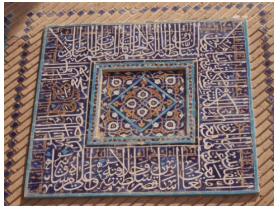
تصویر ۵) کتیبه سمت راست داخل ایوان مسجد مولانا با ذکر نام و القاب شاهرخ

بنای دیگر مسجد جامع هرات است که بر روی ضلع غربی مدخل اصلی آن کتیبه ای سنگی نصب شده که اشاره به موقوفات مسجد از سوی سلطان حسین بایقرا دارد. علاوه بر آن،