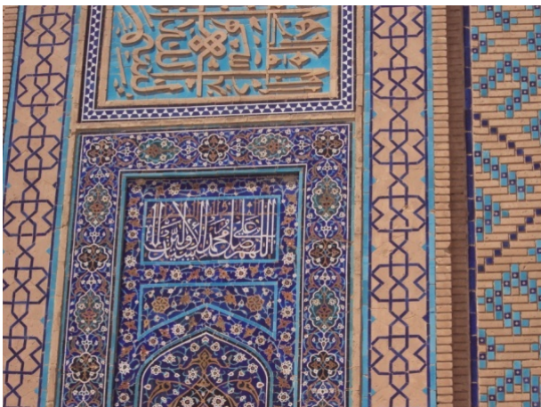
تصویر ۲) کتیبه سمت راست حاشیه ورودی ایوان مسجد مولانا

دعاها مهم‌ترین مطالبی است که انسان برای سعادت اخروی و دنیوی از خداوند درخواست می‌کند و شک را از دل انسانها از بین می‌برد از اینرو با توجه به ضرورت و نیاز جامعه تیموری در اماکن مذهبی نوشته و نصب می‌گردد.