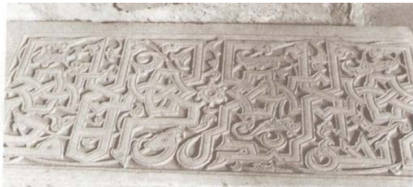
تصویر ۶) کتیبه مناره مصلای گوهرشاد

مرکزیت (حقیقت) دارد در حالی که گره قلب از پیوند دو خط «مقاطع ذوالجهتین» مانند «ها»، «لا» به وجود می آید، وحدت را از طریق تقارن به اجرا می گذارد و گره سرمدی نیز از دو خط «موازی ذوالجهتین» نظیر «کاف»، «صاد» چرخه ای بی انتها تشکیل می دهد که در جهت رفع تناقض متضاد است. یعنی دو خط موازی که از نظر جهت یکی از چپ به راست و دیگری از راست به چپ نوشته می شود به سبب دو حرکت متضاد و متفاوت، گره های پیچ نیز با گردش های متفاوتی پیچیده اند و وحدت را از طریق ترکیب اجزای متضاد به نمایش می گذارند (معصوم زاده و دیگران، ۱۳۹۲: ۱۷). از اینرو آدمی با مشاهده و مواجهه آنها از کثرت بینی و کثرت اندیشی به وحدت رهنمون می شود و با دقت و یقین بیشتری به خداوند می اندیشد.