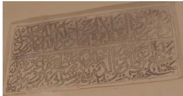
تصویر ۸) کتیبه ایوان قبله مسجد جامع بجنستان

از مساجد دیگر که دارای کتیبه با ماده ساخت بنا هست، کتیبه سنگی ایوان قبله مسجد جامع بجنستان است که به خط ثلث و به زبان فارسی نوشته شده است. این کتیبه نشان دهنده ساخت مسجد در دوران شاهرخ تیموری و در ۸۲۸ ه.ق که هزینه آن را پهلوان فخرالدین فرزند سیف‌الدین مقدمزاده نرشاتی پرداخت کرده است. از آنجایی که در کتب تاریخی تیموری یادگی از نام و نشان این مسجد نشده است، این کتیبه اهمیت بسزایی در شناخت تاریخ ساخت بنا دارد.