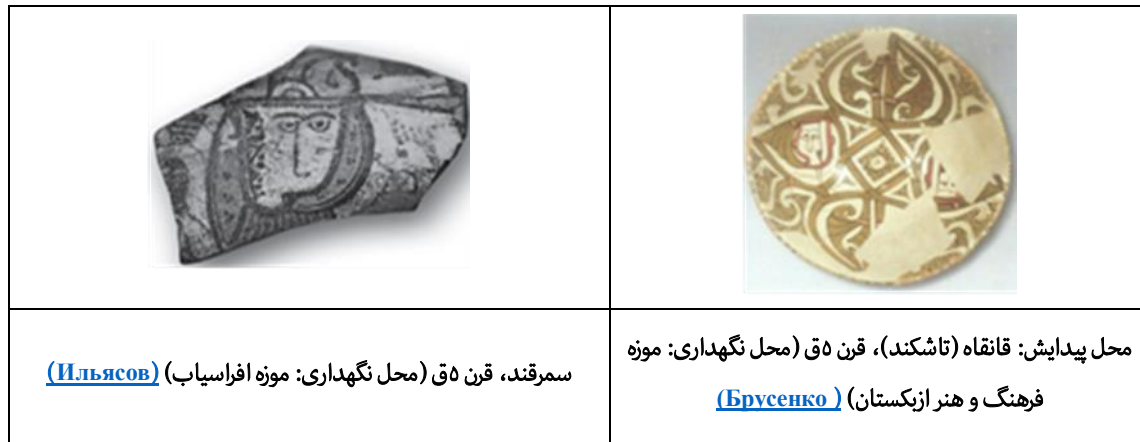
جدول ۴: نمونه آثار سفالی با مضمون درخت سخنگو

هنرمند در ترسیم ماهی حرکت و چرخش را که از ارکان اصلی حیات این موجود بوده، بر سفال منعکس ساخته است (تصویر ۱). ماهی دارای ویژگی اسطوره‌ای در این منطقه بوده و از دیرباز، نقش پرندگان گوناگون سمبل بسیاری از مفاهیم تلقی می‌شده‌اند. به اعتقادی پرنده نماد گستردگی روح است بخصوص در زمانی که بعد از مرگ به آسمان صعود می‌کند، پرندگان از ویژگی هوا محسوب شده و تجسم‌کننده هوا و یکی از چهار عنصر بشمار می‌رفته‌اند. (Hall, 2008) با این اعتقاد کاربرد زیاد نقش پرندگان در ماوراءالنهر به حالت طبیعی و یا با ایجاد ویژگی‌هایی که در حالت چشمانشان ترسیم می‌شد، حالتی مرموز به خود گرفته، وجود پس‌زمینه اعتقادی را عیان می‌سازد.