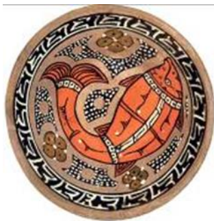
تصویر ۱: کاسه، نقش ماهی، سمرقند، قرن ۴ق، مجموعه دیوید (Pyasove, 2014)

طبق تحقیقات نگارندگان، نقوش انسانی برای بیان مقاصد اعتقادی به‌طور محدود کاربرد داشته و در برخی آثار جنبه روایتگری اجرای مراسم مذهبی و شفابخشی داشته است و گاهی از ترکیب نقش انسان و موجودات شبه حیوانی برای بیان مقاصد جادویی بومی منطقه بهره‌برداری شده است و کاربرد تصاویر حیوانات، پرندگان و ماهیان و گوزن با توجه به مفهوم نمادین محلی و فرهنگ‌عامه به‌کار گرفته می‌شده است (Pugakhpegova & Khakimov, 1993). به تعبیری، در استفاده از نقوش حیوانی، هنرمند برای ترسیم نقوش به حالت واقع‌گرایانه که در پس اعتقادات بومی ایشان بوده، تلاش نموده است. به‌کرات نقش تزئینی ماهی باحالتی انتزاعی و واقع‌گرایانه در تزئین سفالینه‌ها خودنمایی می‌کند.