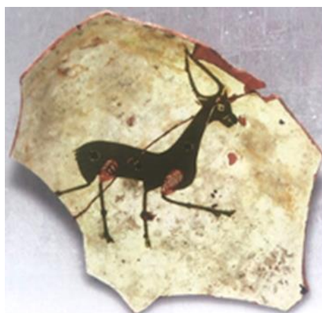
تصویر ۱۳: کاسه با نقش گوزن، قرن ۵ ق، محل کشف توپتپا، محل نگهداری گام ایکس موزه تاشکند (Ильясов, 2016)

نقشی دیگر که در میان تزئینات جانوری ماوراءالنهر مشاهده می‌شود، نقش گوزن و بزغاله است. این حیوانات در افسانه‌های مردم ایران و ترک محبوب بوده‌اند و نیز به‌طور گسترده در آثار سکاها نشان داده شده و نماد باروری دانسته