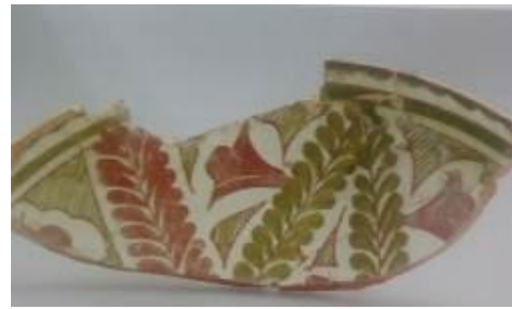
تصویر ۷: تکه کاسه، شکوفه انار، قرن ۴ ق، چاچ (Ильясов, 2016)

مشابه تزییناتی با موتیف انار به‌گونه‌ای واقع‌گرایانه در ناحیه اخشیکت یافت شده است (تصاویر ۹-۱۰). نقش انار که در سده چهارم هجری قمری در سمرقند و چاچ ظاهر شده بود، در قرن پنجم هجری قمری در بین تزیینات اخشیکت قرار گرفت (Henshaw, 2010).