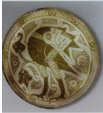
تصویر ۲: بشقاب، نقش هارپی، قرن ۵ق، محل کشف: خراشکت (قانقاه)، محل نگهداری: مجموعه خصوصی تاشکند (Imaberdive & Ilyasov, 2013)

شده است (تصویر ۲) این نقش که هارپی نام دارد در لغت‌نامه دهخدا این‌گونه معنا شده است: «نام سه موجود عجیب‌الخلقه بال‌دار، با چهره زن و بدن کرکس، این موجود ناخن‌هایی برجسته دارد و مرگ و کشمکش شدید را تجسم می‌بخشد» (Dehkhoda, 1998). البته در تمدن‌های گوناگون اورارتو، یونانی و ایرانی معانی متفاوتی از این نقش استنباط می‌شود (Rahmani & Mahmoodi, 2017) و چهره‌پردازی این موجود با تنوع بسیار در مناطق مختلف تصویر می‌شده است. (White Muscarella, 1962) (تصویر هارپی، جدول ۷).