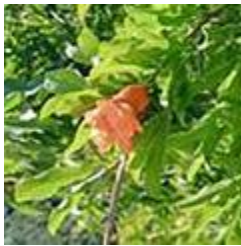
تصویر ۸: گل انار

مشابه تزییناتی با موتیف انار به‌گونه‌ای واقع‌گرایانه در ناحیه اخشیکت یافت شده است (تصاویر ۹-۱۰). نقش انار که در سده چهارم هجری قمری در سمرقند و چاچ ظاهر شده بود، در قرن پنجم هجری قمری در بین تزیینات اخشیکت قرار گرفت (Henshaw, 2010).