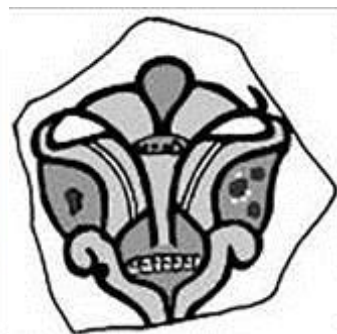
تصویر ۹-۱۰: قطعه کاسه، نقش انار، قرن ۵ ق، اخشیکت (Henshaw, 2010)

بر سفال لعاب‌دار با ویژگی‌هایی که در آن مشهود است حالت مخوفی از خود نشان می‌دهد. با این اوصاف، بنا به نظر نگارندگان، گویا این نوع نقوش بنا به درخواست سفارش‌دهنده برای موارد خاصی به‌کار می‌رفته‌اند (تصویر ۱۲). در تعدادی نمونه آثار در سمرقند و چاچ، با نقش پرنده تیره‌رنگ با مردمک چشم قرمز که حالتی شوم و مخوف به مخاطب القا می‌کنند، مواجه می‌شویم (Брусенко, 1975). ترسیم این نوع آثار به روش واقع‌گرایانه انجام پذیرفته است. با این حال، امکان اینکه این آثار برای مواردی همچون جادو و طلسم استفاده می‌شده‌اند، وجود دارد. جدول تصاویر شماره ۶، آثاری مشابه با این روش ترسیم واقع‌گرایانه از نقش پرنده را در تلفیق با کتیبه کوفی نمایش می‌دهد.