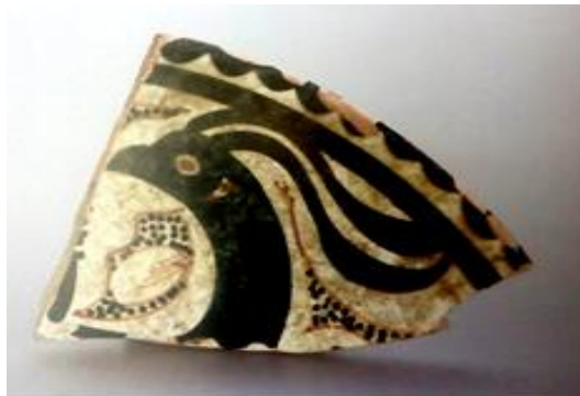
تصویر ۱۲: کاسه با نقش سر پرنده، قرن ۵ق، محل پیدایش: مینگوریک، شهرستان، چاچ (Брусенко, 1975)