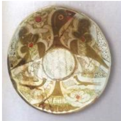
تصویر ۱۱: پرنده، قرن ۵ق محل نگهداری: موزه دولتی تاریخ تیموریان، تاشکند، کد: ت-۷۹ جامی، ب ۵ شماره اموال ک پ ۲-۸۰ (Ильясов, 2016)

برخلاف عدم کاربرد این نقوش بر ظروف سفالی نیشابور، مشابه این نقوش با روش ترسیم واقع‌گرایانه به صورت نقاشی دیواری، در تزئین بناهای قنات تپه نیشابور مشاهده شده است (Wilkinson, 1987) (جدول ۷).