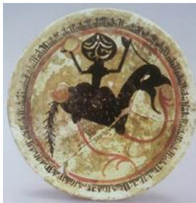
تصویر ۶: کاسه، منتسب به خراشکت قانقاه، قرن ۵ق (Kuehen, 2011)

مرموز بودن این اثر با حالت ارائه نقش پرنده تکمیل می‌شود؛ حالتی همچون پنجه‌های بلند و چشمان سفید بدون مردمک. ظاهر انسان با سری عجیب احتمالاً به ماهیت غیرانسانی این موجود اشاره می‌کند و گویی شخصیتی