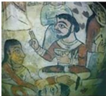
تصویر ۵: سفال، مرو، قرن ۲ق (Imamberdiev & Ilyasov, 2017)

شیطانی شبیه جن‌ها و سایر موجودات مشابه آن است. مشابه این‌گونه تصاویر در سفالینه‌های نیشابور یافت نشده است.