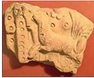
تصویر ۴: سفال سمرقند، اواخر قرن ۲ ق، موزه ارمنیاز (Gerardine Fray, 2011)