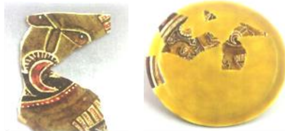
تصویر ۲: نقش ماه و اژدها، محل ساخت: بینکات ۲ ، قرن ۴-۵ق (Ильясов, 2016)

محبت‌آمیز داشته باشند (Ilyasov, 2013). این نقش بارها توسط هنرمندان باستانی خراشکت به تصویر کشیده شده است.