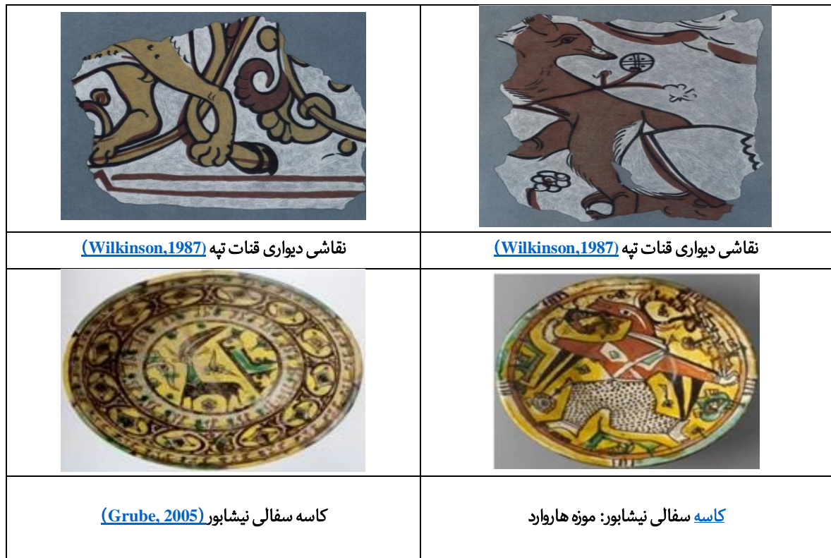
جدول ۸: مقایسه نقوش جانوری سفالینه و نقاشی دیواری نیشابور

که دارای شاخ‌های شمشیری منحنی به عقب است بُج جدی را نشان می‌دهد (Ильясов, 2016). البته در بین سفال‌های نیشابور نیز تصاویر حیواناتی همچون بز و گاو در تلفیق با نقوش انسانی با دلایل نجومی ترسیم می‌شده‌اند (Beik Mohammadi et al, 2020). این سفال‌های منقوش نیشابور برخلاف شیوه طراحی مناطق دیگر ماوراءالنهر به حالت واقع‌گرایانه نزدیک نیستند. با مقایسه‌ای بین نقوش جانوری ترسیم‌شده بر سفال و نمونه آثار برجای‌مانده از نقاشی‌های دیواری در منطقه قنات تپه نیشابور (Wilkinson, 1987) می‌توان بیان داشت که نمونه نقاشی‌های دیواری نیشابور به روش واقع‌گرایانه ترسیم