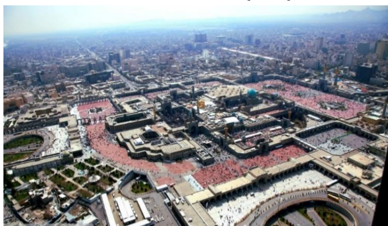
تصویر ۳: عکس هوایی از مجموعه حرم مطهر امام رضا (ع) .

معرفی و بررسی نمونه موردی: در طول ادوار تاریخی، مرقد امام رضا (ع) تبدیل به زیارتگاهی مهم در میان مسلمانان مورد احترام حاکمان (چه شیعه و چه غیرشیعه) قرار گرفته است (Mehmanavaz, 2021: 2). این مجموعه (تصویر ۳) با