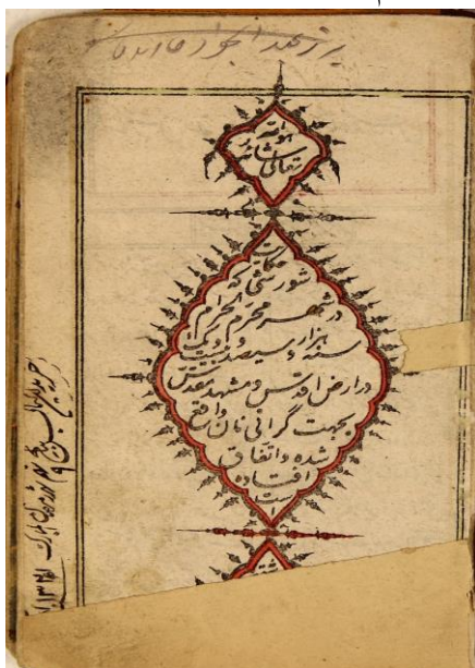
تصویر ۱: تصویر صفحه اول نسخه شماره ۵۰۴۸۰ مرکز نسخ خطی آستان قدس رضوی

نسخه دوم نیز با عنوان غیرتیه شورش خلق و غیرت ناموس به شماره ۵۰۴۸۰ در یک مجموعه رسائل در مرکز نسخ خطی آستان قدس رضوی ثبت شده است. صفحه‌آرایی این نسخه کاملاً بر مبنای قطع و اندازه و صفحات نسخه قبلی است. دو نقاشی در صفحه ۶ و ۷ دارد. نقاشی هر دو نسخه با تفاوت‌های اندکی در چهره و نحوه قرار گرفتن افراد از ساختار یکسانی برخوردارند، با این تفاوت که در تصویر صفحه هشتم، عنوان عمل محمدحسن خان ذکر شده است. خط نسخه نستعلیق خوش است و از نسخه اول کیفیت چاپ و خط بهتری دارد. مطبعه این نسخه نیز معلوم نیست.