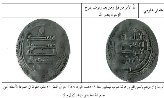
تصویر ۲: سکه رافع بن هرثمه، ضرب شده در ۲۶۹ق، نیشابور (دسوقی، ۲۰۲۱: ۹۷)

بر اساس شواهد سکه‌شناسی و تأیید منابع تاریخی چند ماه بعد از تسلط او بر نیشابور، رافع بن هرثمه بر این شهر تسلط یافته است (دسوقی، ۲۰۲۱: ۹۶). رافع بن هرثمه بعد از شکست ابوظلحه منصور و اخراج او از نیشابور سکه‌هایی را ضرب نمود. نکته جالب در مورد سکه‌های ضرب شده رافع در نیشابور این است که نام خلیفه معتمد و نام خود رافع بر روی سکه نقر شده است که این موضوع نشان از آن دارد که رافع خود را حاکم مستقلی می‌دانست و به دنبال کسب مشروعیت از خلیفه عباسی بوده است (همان: ۳۱-۲۸). هرچند خلیفه عباسی رافع را او را به‌عنوان حاکم مستقل به رسمیت نشناخت و شاهی وجود ندارد که برای او منشور حکومت ارسال کرده باشد و او حدود دو سال بعد بود که به‌عنوان نایب محمد بن طاهر مشروعیت یافت.